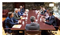
En Canarias promueven acuerdo...