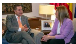
La Junta iniciará la próxima semana lo... lavozdeltajo.com