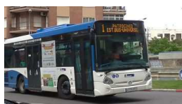
Los conductores de los autobuses urbanos d...