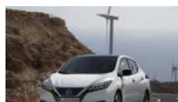
El nuevo Nissan LEAF 2018 galardonado co...