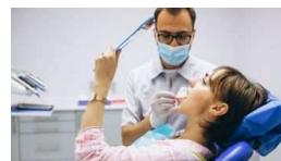
Formación bucodental, una profesión llena d... Emprendedores, Tecnolo...