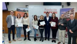
La Universitat de les Illes Balears gana el C... mallorcadiario.com