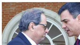
Torra y Sánchez juegan al despiste cronicamadrid.com