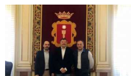
Colegio de Médicos y Ayuntamiento analiz... cuencanews.es