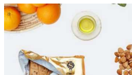
Finaliza con éxito la campaña "Historias e... mercacei.com