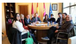
El Ayuntamiento de Albacete confirma a l... albacetediario.es