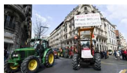
En plena guerra del campo, España